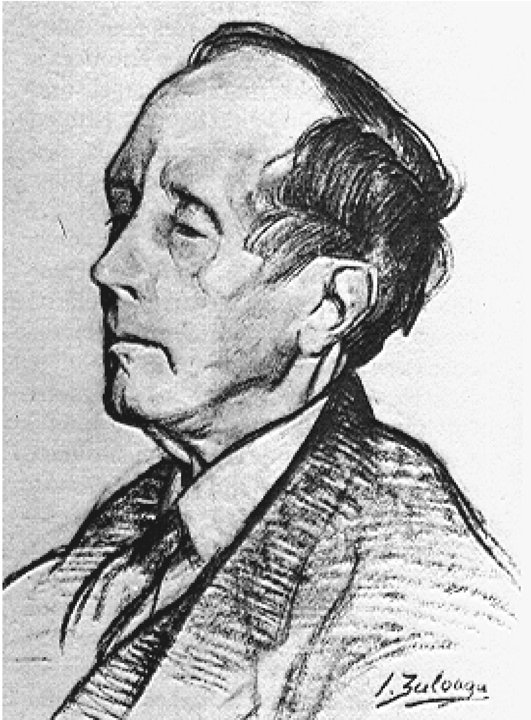
Azorín. Dibujo por Ignacio Zuloaga