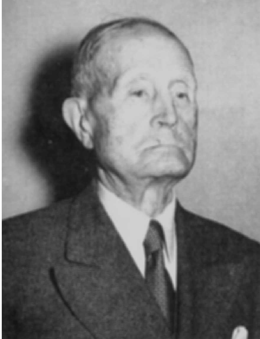
José Martínez Ruiz "Azorín"