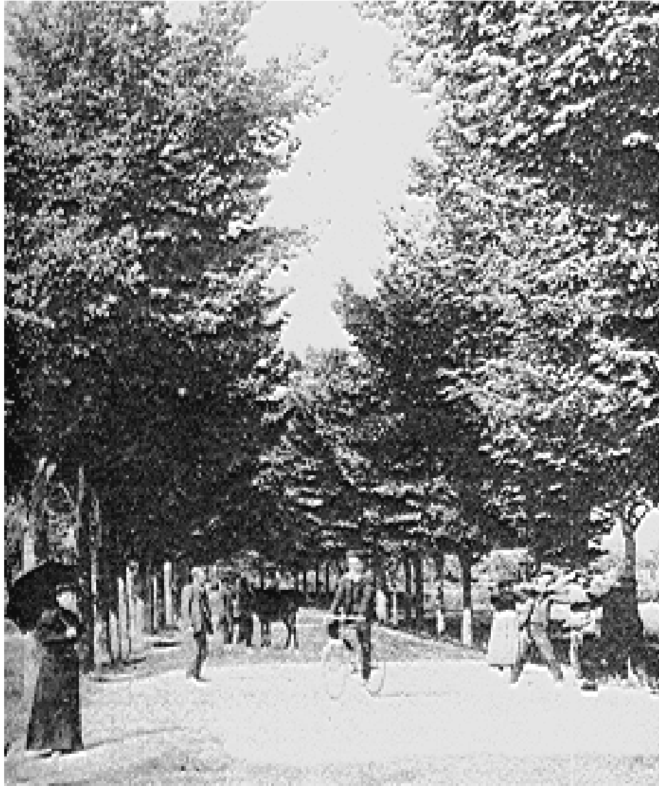
Paseo de la Alameda de Yecla