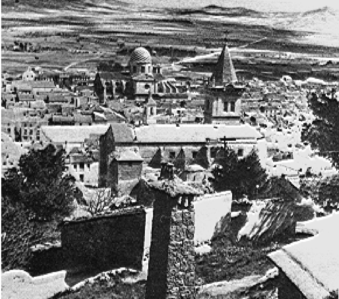
Yecla (Murcia). Vista parcial