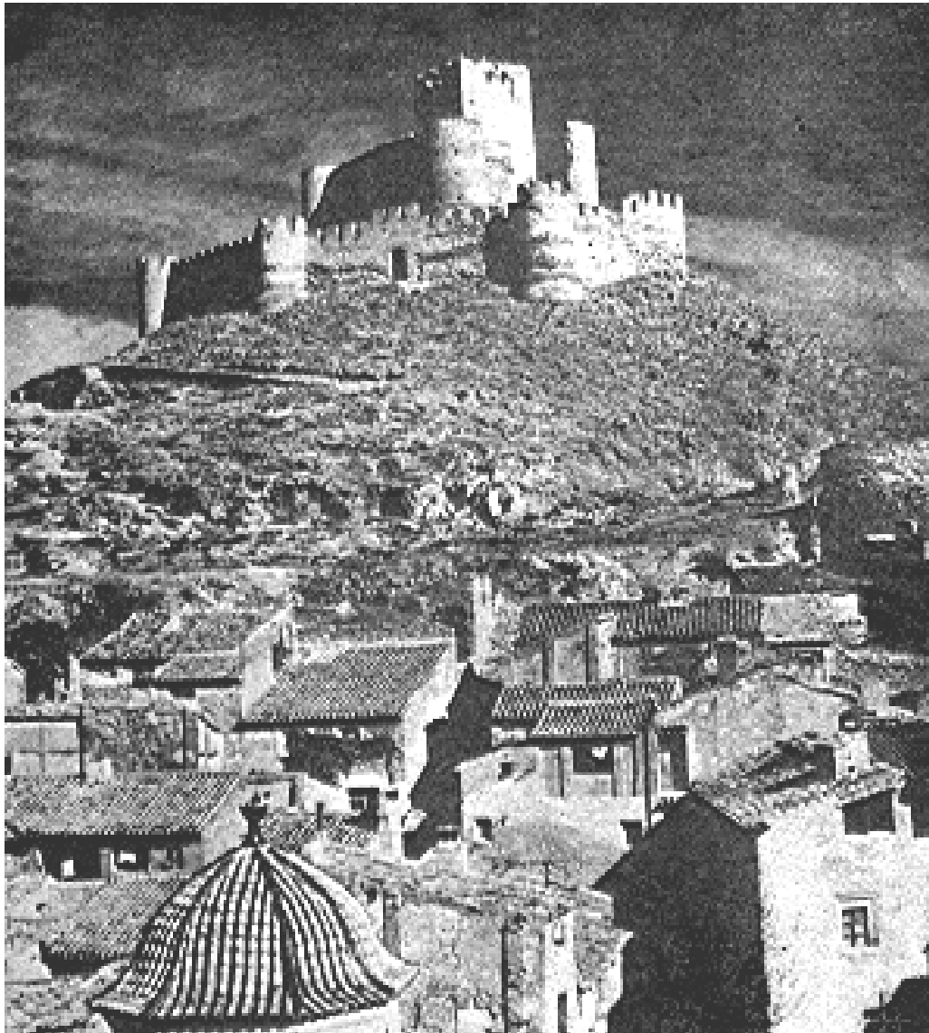
El castillo de Biar dominando la población

de madera y con su acetre de cobre para sacar el agua, y al otro lado de la dicha losa está la almofía o palangana, colocada en aro de hierro que surte del centro de un cuadro de azulejos. En el verano, las alcarrazas y los cántaros, llenos de fresca agua, van rezumando gotas cristalinas, y en la penumbra y el silencio en que está sumida la casa, en tanto que fuera abrasa el sol, es éste un espectáculo que nos trae al espíritu una sensación de alegría y reposo.