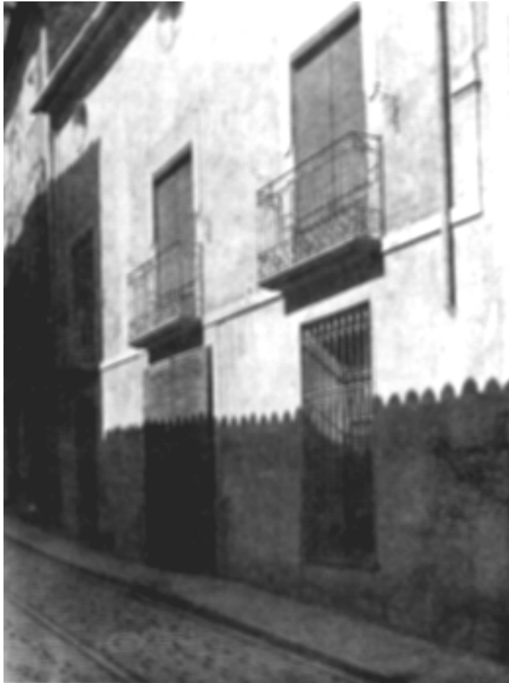
Casa natal de Azorín

Algunas palabras del autor en distintos pasajes de la obra lo declaran muy explícitamente. «Cerner los recuerdos»: así pudiéramos enunciar el procedimiento puesto en uso para la composición de éste y de otros libros suyos de memorias. 6